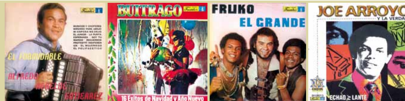
Fruko, Joe, Los Hispanos y los Corraleros de Majagual nacieron en las aguas de Fuentes.